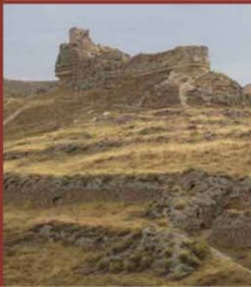
El "Lugar Viejo"